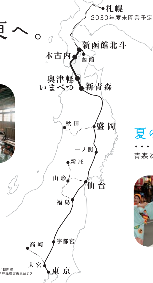
※平成27年1月14日開催 政府与党整備新幹線検討委員会より