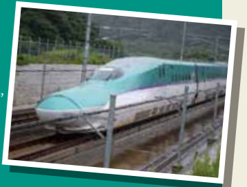
Hokkaido Railway Company Series H5

ฮอกไกโดซังกันเซ็งใช้รถไฟซีรีส์ H5 โดยความเร็วสูงสุดที่กำหนดของมันมากถึง 320 กม./ชม.! แถบสีม่วงตรงกลางของรถไฟแสดงถึงโลแกลด์ลูไฟน์ และลาเวนเดอร์อันสวยงามของฮอกไกโด