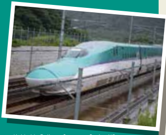
Hokkaido Railway Company Series H5

홋카이도 신칸센은 H5 시리즈 열차를 사용한다. 지정된 최대 속력은 320km/h이다! 기차 중앙의 보라색 줄무늬가 홋카이도의 아름다운 라일락, 루핀, 그리고 라벤더를 표현한다.